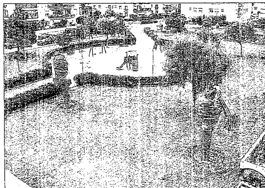
Dos ejemplares de palmera afectadas por el picudo en Calafell. Los ejemplares deben tratarse para evitar la propagación.

Si la palmera ya está afectada hay que comunicarlo al Ayuntamiento (977 67 92 04) o a los servicios territoriales de Agricultura